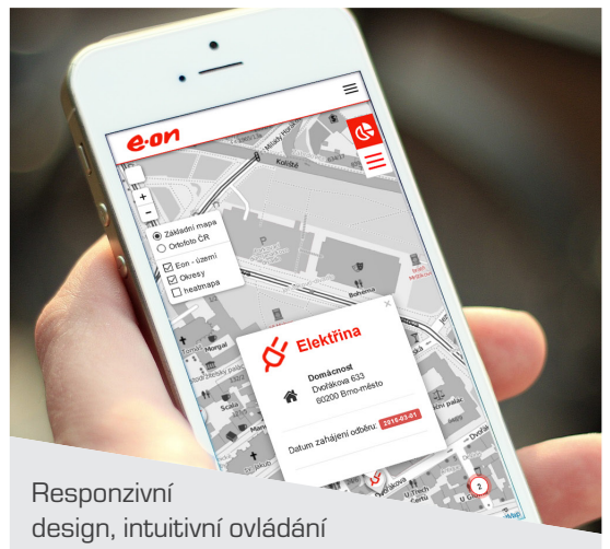
Responzivní design, intuitivní ovládání